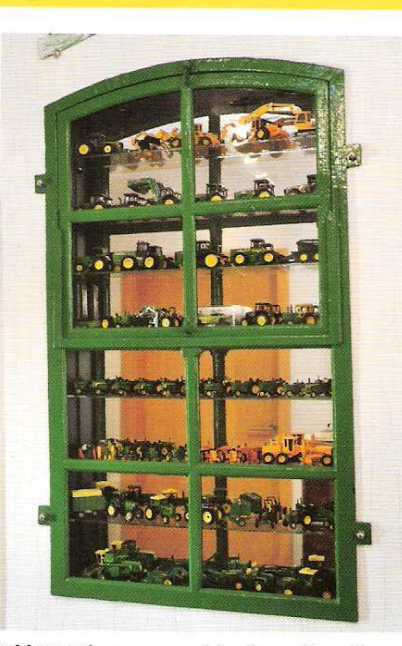
Schlepper kommen auch ins Haus: Monothematischer Setzkasten im Hause Brunkhorst.