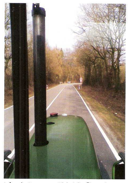
Leben in Bewegung: Ob bei der Übergabe beim Vorbesitzer, bei der Holzernte, beim Treffen auf Gut Dobershof oder auf einer Landstraße im Norden – Stillstand kennt der 50er nicht…