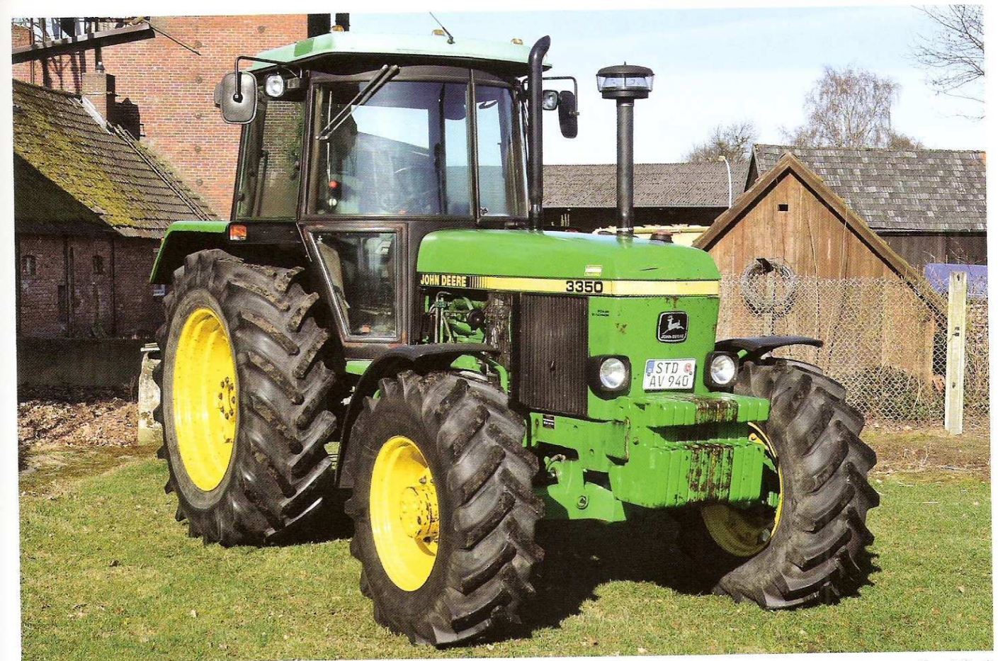
Neuzugang: Der 3350 mit 100 PS kam 2012 vom Niederrhein nach Ahlerstedt.